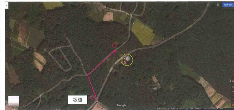
赤丸が物件の位置、黄丸が物件から見える建物の位置です。