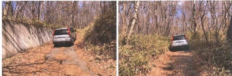
町道からの侵入路は坂道です